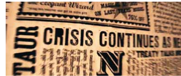
Sequenzen aus / sequences from: Harry Potter