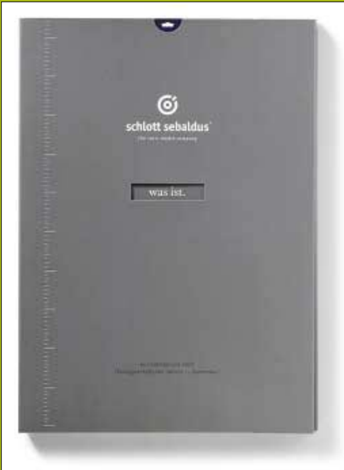
Der Geschäftsbericht 2003, den strichpunkt für die schlott gruppe AG entwarf, veranschaulicht Gegenwart und Zukunft auf spielerische Weise: Klappt man den Umschlag aus Karton auf (rechts oben), befindet sich auf der rechten Seite der eigentliche Geschäftsbericht und auf der linken eine mit Drahtkamm gebundene Broschur über die Zukunft des Werbemarkts. Über ausziehbare Karten lässt sich der Inhalt von Texten, Tabellen und Grafiken verändern (rechts Mitte und unten)